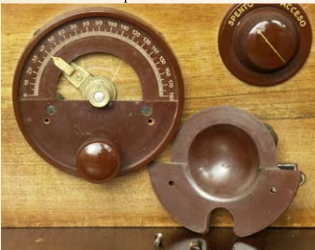
Particolare della manopola smontata.

Le batterie anodiche erano composte di piccole pile a secco, riunite in blocco paraffinato, montate in un'elegante cassetta di legno di noce lucidato munito di prese adatte al collegamento con l'apparecchio ricevente e con la batteria di