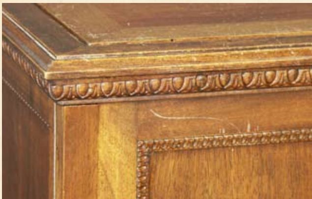
Particolare della lavorazione del mobile.