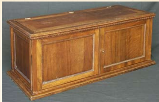
L'aspetto del mobile chiuso.