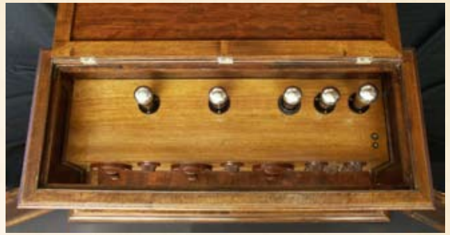
Il mobile con il coperchio superiore alzato.