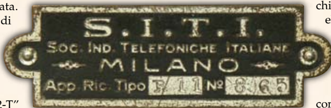
Al centro: particolare della targhetta identificativa.

Posteriormente è dotato di due finestrelle in ebanite con le diciture "batterie" e "A1-A2-T" incise e riempite in pasta bianca, alle quali si affacciano le corrispondenti boccole fissate sul pianale interno. Sulla sommità il ripiano è apribile con un meccanismo a scatto, ma la cornice dentellata di bordo rimane fissa e al tempo stesso costituisce "l'ossatura" del mobile, mentre il pannello superiore, quando è chiuso, è incassato ed è complanare alla cornice dando l'illusione di essere un unico pezzo.