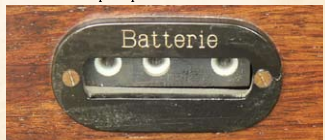
Particolare della presa per le batterie.

La R11, approvato dall'Istituto Superiore P.T.T. col n. 223, è una Neutrodina realizzata sul circuito "Difarad" brevettato dalla SITI, che comprende due valvole amplificatrici, in alta frequenza, neutralizzate, una rettificatrice e due amplificatrici in bassa frequenza. Quest'apparecchio serve per la ricezione solo in aereo (25 m), su un campo d'onda da 170 a 650 m. Come recita il "Vademecum del Radioamatore" edito dalla SITI nel 1927, "il circuito brevettato Difarad è