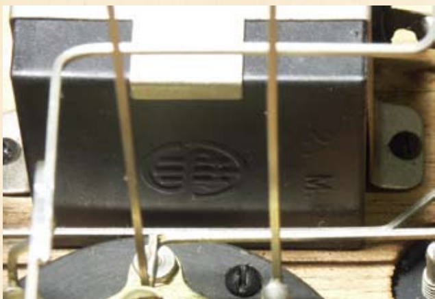
Particolare del logo impresso a rilievo sui componenti.

bile esterno e sulle quali poggia e viene avvita la struttura. Una volta smontata, la radio si riduce a due semplici pannelli di noce da 12 mm disposti a L sui quali è fissata tutta la circuiteria.