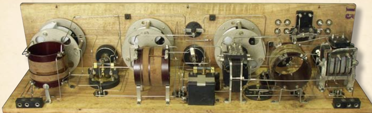
Sopra: vista del circuito.

un altro apparecchio che riuniva in se radio e giradischi! Si trattava di un Siare 251C, il cui acquisto mise in disuso la SITI che però custodì gelosamente in salotto, preservandola dalle distruzioni belle che colpirono anche uno dei suoi appartamenti nel centro storico di Ancona.