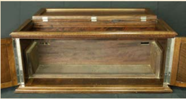
Il mobile vuoto.

l'applicazione di un sistema di "equilibratura" per gli amplificatori ad alta frequenza, che garantisce una perfetta stabilità per tutte le frequenze indipendentemente dal grado di accoppiamento fra primario e secondario dei trasformatori di alta frequenza. Su tali trasformatori non occorre alcuna presa intermedia; semplificazione rilevante per la costruzione.