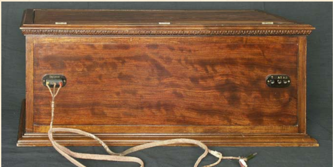
Vista posteriore del mobile.