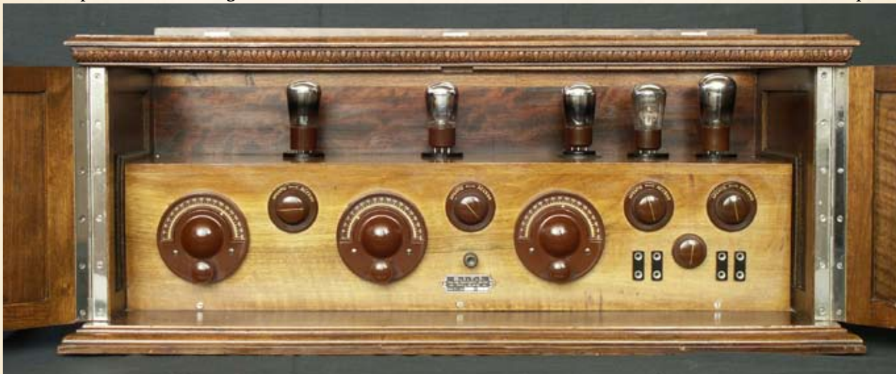
Sotto: il mobile aperto.

Le valvole utilizzate sono, come previsto, dalla SITI: tre del tipo A410 e due B406 tutte di marca Philips e caratterizzate